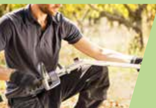
Met één klik wissel je van opzetstuk