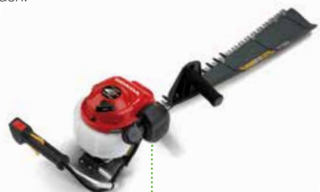
HHH 25S 75