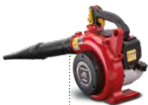
HHB 25 E

Met de luchtstroom tot 600 m 3 /u kunt u ook zwaar en nat vuil wegblazen, en met de cruisecontrol handhaaft u het motortoerental zonder dat u de schakelknop moet blijven indrukken. Dat maakt de blazer extra comfortabel voor langdurig gebruik. De micromotor van Honda loopt soepel en houdt lawaai en trillingen binnen de perken. De mechanische decompressie maakt starten eenvoudig. Dankzij het 360°-smeersysteem kunt u het apparaat in elke gewenste positie gebruiken en opbergen.