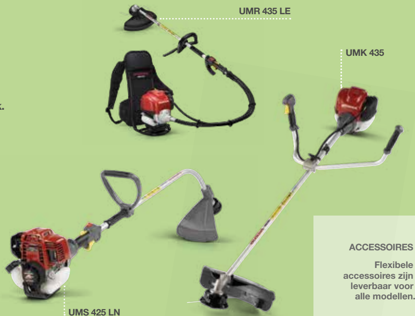
UMR 435 LE

U kunt kiezen uit een uitgebreid assortiment, inclusief een ruggedragen bosmaaier die is ontworpen om zeer wendbaar en comfortabel te zijn. Of wat dacht u van de bosmaaiers met gebogen kop, die worden geleverd met de nylon tap-and-go-kop? Het bereiken van lastige plekjes is op die manier veel gemakkelijker.