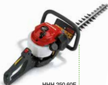
HHH 250 60E